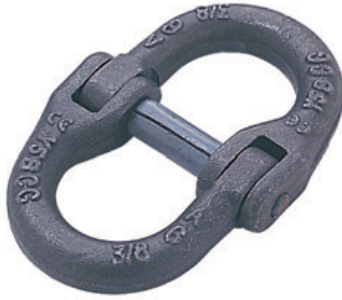
A-336 Eslabón Conector